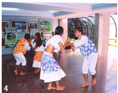
4 O Simpósio de Microscopia na Amazônia foi realizado na FIEPA (Figs. 1, 2). Fig. 3: Solemnidade de abertura. Fig. 4: Show de danças folclóricas durante o coquetel de abertura.